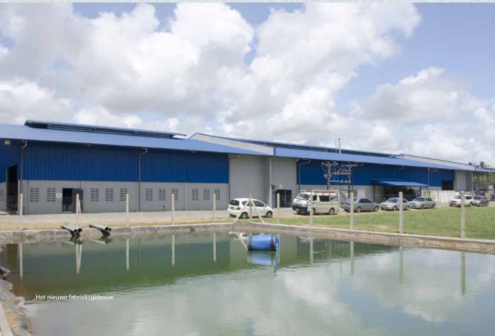
Het nieuwe fabrieksgebouw