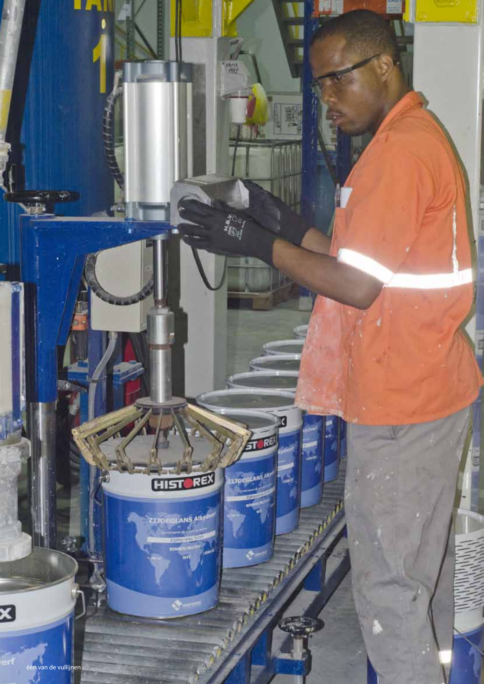
één van de vullijnen